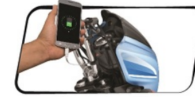
মোবাইল চার্জের সুবিধা