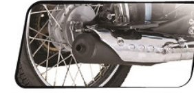
স্টাইলিশ ক্রোম লেগ গার্ড