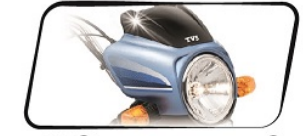
স্টাইলিশ হেডল্যাম্প ফেয়ারিং