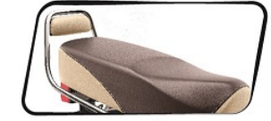
কুশন ব্যাক রেস্ট সহ আরামদায়ক ডুয়েল টোন সিট