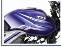
ডুয়েল টোন মাঙ্কুলার ফুয়েল ট্যাঙ্ক