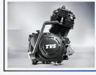
শক্তিশালী ১১০ সিসি ইকোথ্রাস্ট ইঞ্জিন