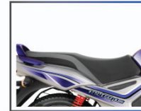
স্টাইলিশ ডুয়েল টোন সিট