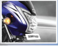
সম্পূর্ণ এলইডি হেডল্যাম্প