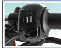
অল গিয়ার ইলেকট্রিক স্টার্ট