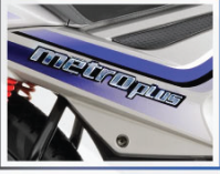
থ্রিডি প্রিমিয়াম লুক