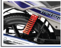
৩টি ধাপে এডজাস্ট্যাবল শক্ অবজারভার