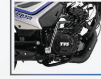
সর্বাধিক শক্তি ৮.৪ পিএস @ ৭০০০ আরপিএম