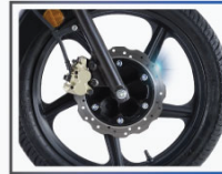
২৪০ মিমি রোটো-পেটাল ডিস্ক ব্রেক অথবা ১৩০ মিমি ফ্রন্ট ড্রাম ব্রেক