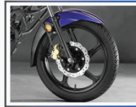
সিস্কোনাইজড ব্রেকিং সিস্টেম